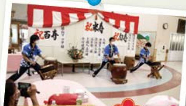
職員による祝太鼓 盛り上がりました